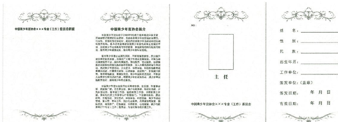
证书尺寸为：打开 A5，对折 14.5*10.5